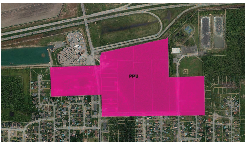
(2018, 528-9, a. 4.)

Celles-ci sont devenues des affectations commerciales et forme le PPU.